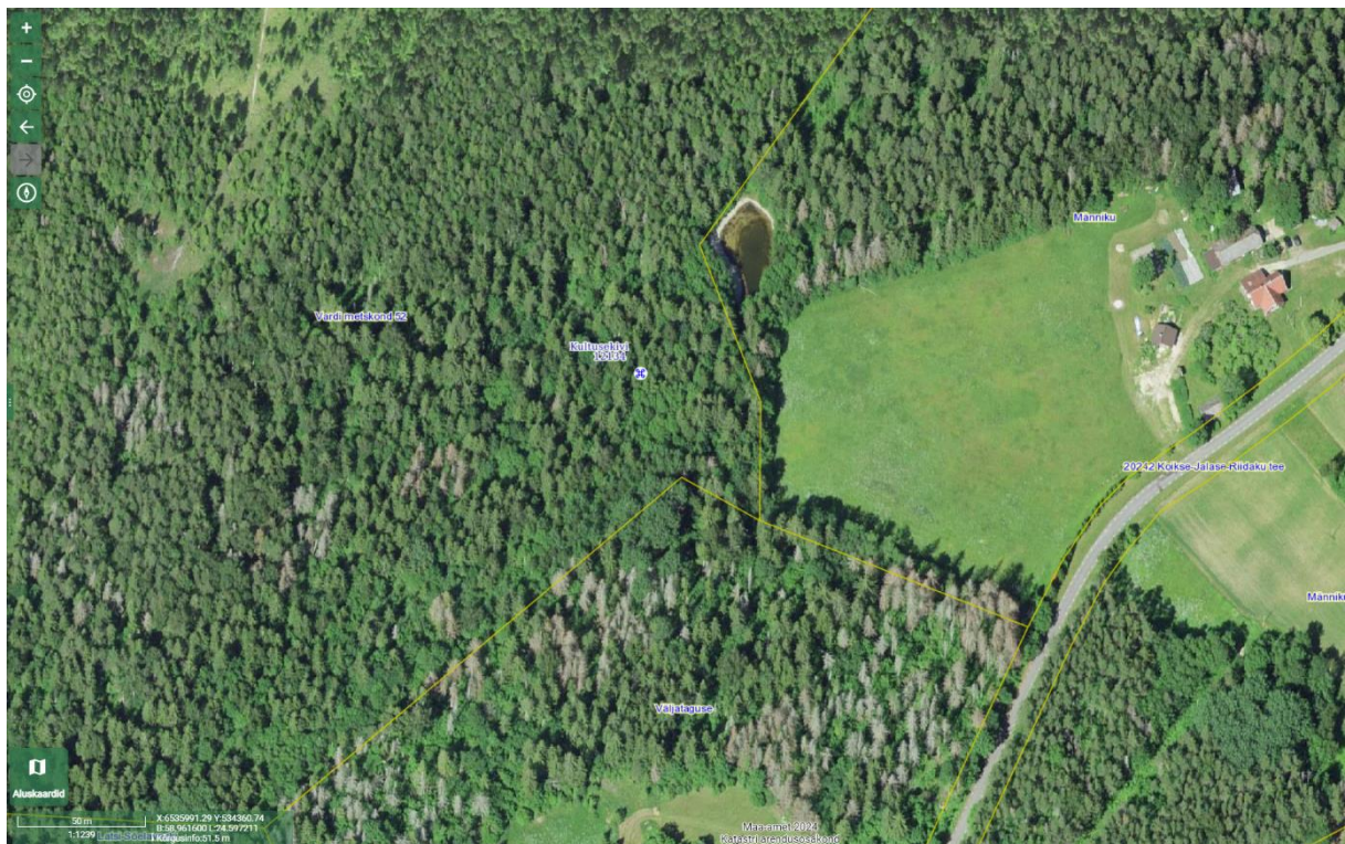
Lisa 1. Kultusekivi reg-nr 12134 asukoht Maa-ameti kultuurimälestiste kaardikihil seisuga 19.01.2024. (Alus: Maa-ameti kultuurimälestiste kaardikiht)