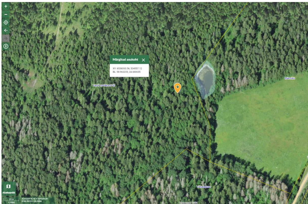
Lisa 2. Kultusekivi reg-nr 12134 tegelik asukoht oranži tingmärgiga (XY: 6536063.56, 534557.12). (Alus: Maa-ameti kultuurimälestiste kaardikiht)